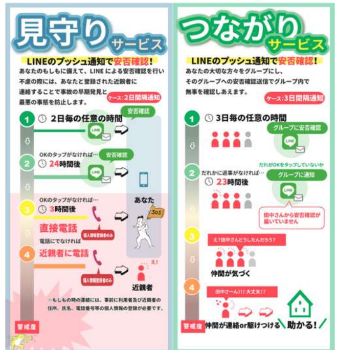
▲「見守りサービス」と「つながりサービス」の概要